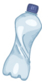
প্লাস্টিক বোতল (১ লিটারের বোতল)