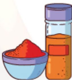
লাল ফুড কালার (অপশনাল)